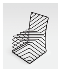
thin black lines