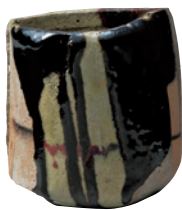
十五代 樂吉左衛門 焼貫黒楽筒茶碗 銘 我歌月徘徊