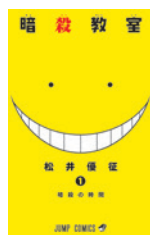
『暗殺教室』全21巻集英社 ジャンプ・コミックス刊定価400円+税 © 松井優征/集英社